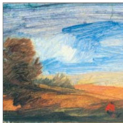
Schon fast abstrakt: Landschaftsbild von Wilhelm Busch (1895)

für die Wochenendbeilagen seiner Zeitungen „einen Strip wie Max und Moritz“. Den lieferte ihm Woche für Woche Rudolph Dirks. In der amerikanischen Fassung hießen die auf die Schadenfreude der Leser bauenden kleinen Helden „Katzenjammer Kids“. Von ihnen wurde unter dem Titel „Max und Moritz“ für die deutschen Immigranten eine Variante in