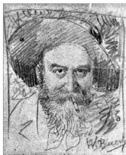
Wilhelm Busch, ein Selbstbildnis aus dem Jahr 1895

Der Rundgang beginnt mit penibel realistisch ausgeführten akademischen Studien, die uns etwa einen „Stehenden männlichen Akt in versonnener Haltung“ (Bleistift, 1854) zeigen. In anderen frühen Arbeiten, die mit Ölfarben oder Bleistift ausgeführt sind, geht Busch hingegen seinen privaten motivischen Vorlieben